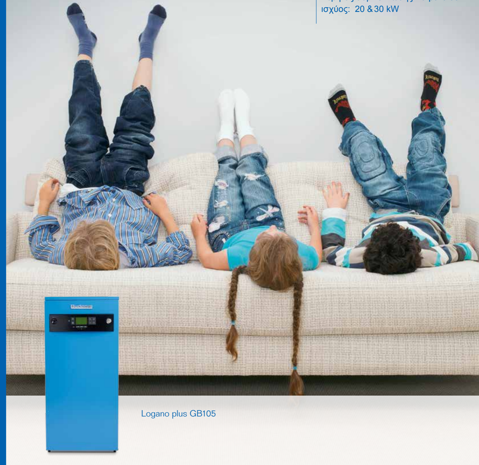
Logano plus GB105

Λέβητας συμπύκνωσης πετρελαίου ισχύος: 20 & 30 kW